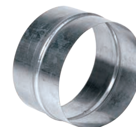
Giunto acciaio inox Stainless steel connection

Consente la giunzione tra due tubi flessibili acciaio inox parete semplice dello stesso diametro. To connect two stainless steel flexible flue pipe sections, simple surface, of the same diameter.