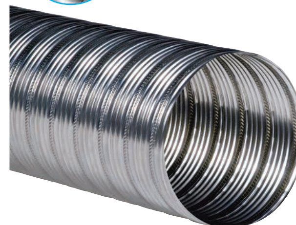
Flessibile parete semplice Flexible corrugated surface

Corrugato internamente ed esternamente. Ottima flessibilità, buona resistenza sia termica che meccanica ed è consigliato per condotti di aspirazione scarico aria ad uso industriale e civile funzionanti a pressione negativa con esclusione dello scarico fumi. Corrugated inside and outside. Excellent flexibility, good thermal and mechanical resistance; it is most suited for industrial and civil negative pressure air suction and discharge systems. It is not suited to smoke evacuation systems.